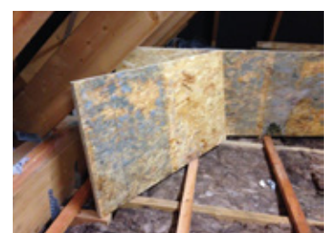
Keine Lösung im Dachspeicherboden sind diffusionsdichte Plattenwerkstoffe mit der Folge von Schimmel.