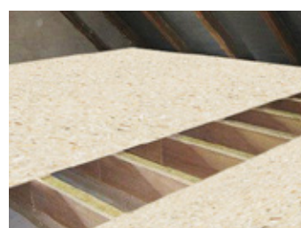
esb (elka strong board) als Deckenplatte im Dachstuhl.